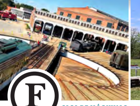
F CASA DE MÁQUINAS Y TORNAMESA FERROVIARIA Construida en 1924 para el mantenimiento y reparación de locomotoras de vapor. Alberga locomotoras y vagones de ferrocarril, así como exhibiciones de ferrocarriles y aviación, incluyendo una réplica del Wright Flyer de 1903.