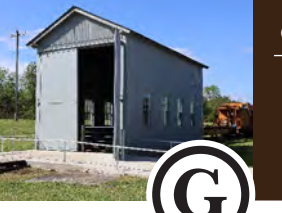
G TALLER DE BALANCEO DE RUEDAS Construido en 1944, este taller alberga un conjunto de balanzas utilizadas para pesar y equilibrar locomotoras de vapor. aviación.