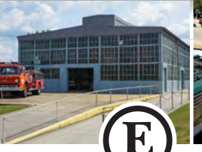
E TALLER DE CALDERAS Construido en 1924, este edificio alberga la exposición Bumper to Bumper.