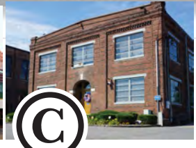
C OFICINA DEL JEFE DE MECÁNICOS Construido en 1911, este edificio alberga la estación de regalos y exposiciones temporales.